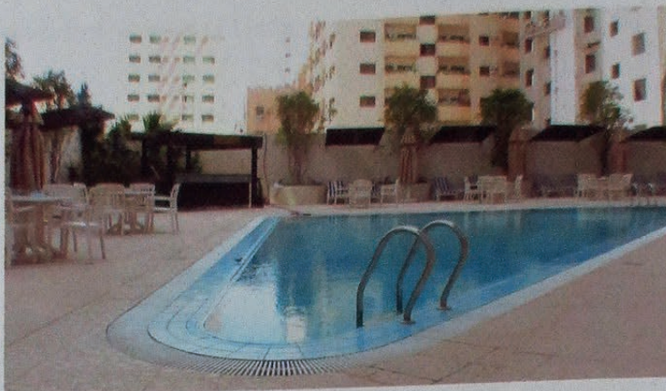
rotana fountain, 2007 Intervention (Sharjah, UEA), Video